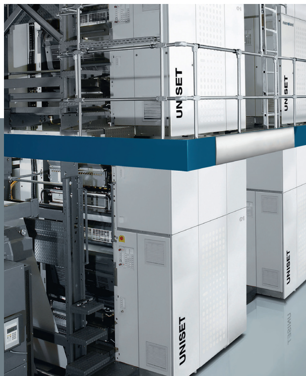
Variable web widths for a flexible UNISET Variable Bahnbreiten für eine flexible UNISET

For more information please visit: Weitere Informationen finden Sie unter: